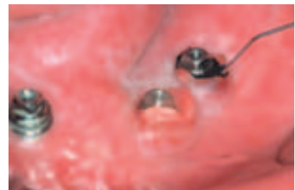
Abb. 1: HELBO®Theralite Laser mit 3-D-PocketProbe und HELBO® Blue Photosensibilisator. – Abb. 2: Periimplantitis bei Candida albicans Superinfektion bei Z. nach Tumorrekonstruktion mittels Fore-Arm-Flap. – Abb. 3: Applikation des Photosensibilisators mittels stumpfer Kanüle in periimplantäre Pseudotasche.