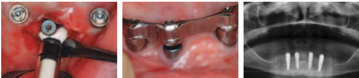
Abb. 13: Applikation von PepGen P15 zur knöchernen Regeneration. – Abb. 14: Stabile Weichgewebsverhältnisse beim Recall nach drei Monaten. – Abb. 15: Regeneration periimplantären Defekts Regio 43 nach Dekontamination.

auch über einen Gazestreifen appliziert werden, der zur Tamponierung der Wunde verwendet wird. Nach erfolgreicher Inkubation von mindestens 60 Sekunden erfolgt die Spülung des Operationssitus mit 0,9 % Kochsalzlösung. Da der Photosensibilisator eine hohe Absorption zeigt, ist es wichtig, dass das überschüssige Material vollständig ausgespült wird, da sonst das Laserlicht nicht an der Membran der Bakterien wirken kann. Die Aktivierung des Photosensibilisators erfolgt mit dem HELBO®Theralite Laser mit Licht der Wellenlänge 670 nm für 60 Sekunden. Je nach Defektgröße kann dann das Knochenersatzmaterial zur Augmentation des knöchernen Defektes appliziert werden. Anschließend erfolgt der Wundverschluss. Postoperativ werden dem Patienten die üblichen Verhaltensmaßnahmen empfohlen. Am ersten postoperativen Tag wird eine Nachkontrolle durchgeführt und die initiale Wundheilung beurteilt. Die noch verbliebenen Anteile des Photosensibilisators werden erneut für 60 sec. mit dem Therapielaser aktiviert. Nach einer Woche werden die Nähte entfernt.