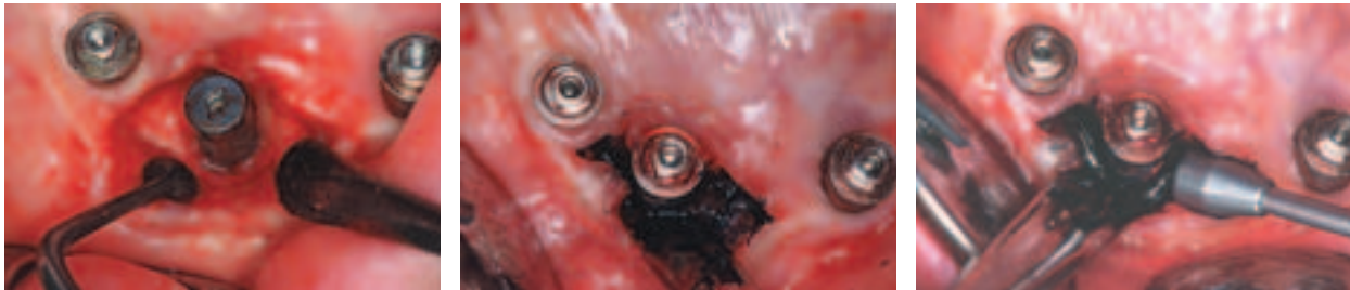
Abb. 10: Z. n. offene Kürettage bei vestibulärem Knochenabbau. – Abb. 11: Nach Ausbleiben der ersten reaktiven Blutung aus dem OP-Areal Applikation des Photosensibilisators im Überschuss. – Abb. 12: Aktivierung des Photosensibilisators mittels Oberflächensonde.