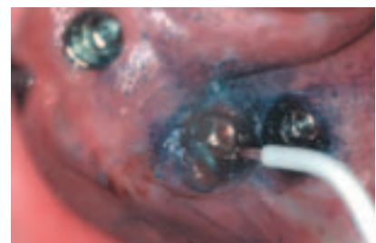
Abb. 4: Inkubation des im Überschuss applizierten Photosensibilisators in infizierten Arealen. – Abb. 5: Spülung mit Kochsalzlösung zur Entfernung des überschüssigen Photosensibilisators. – Abb. 6: Bestrahlung mittels 3-D-PocketProbe und HELBO®Theralite Laser.